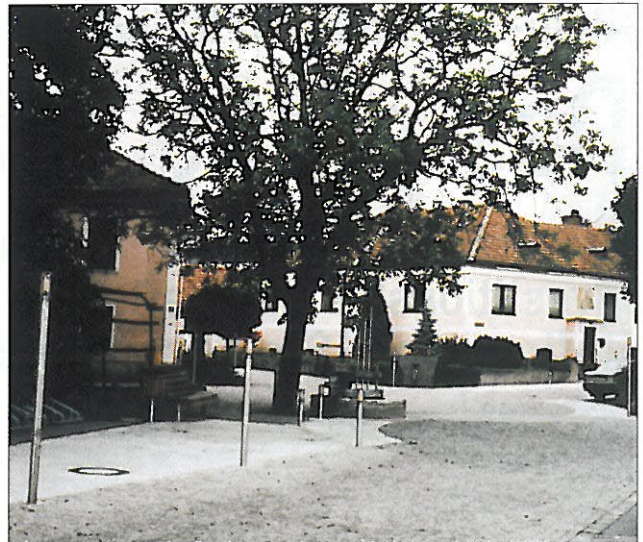
Zwei 2. Preise für die die Gestaltung eines Marktplatzes in Klein-Pöchlarn (oben) samt Anbindung an den Donauradweg (Bezirk Melk) sowie für die Revitalisierung des Schüttkastens Ebenthal, Bezirk Gänserndorf (unten)

Bild unten: 1. Preis für die Rettung der Burg- arena Reinsberg, Bezirk Scheibbs. Hervor- stechend die einfühlsame Verbindung alter Bausubstanz mit zeitgemäßen Architekturformen und Materialien